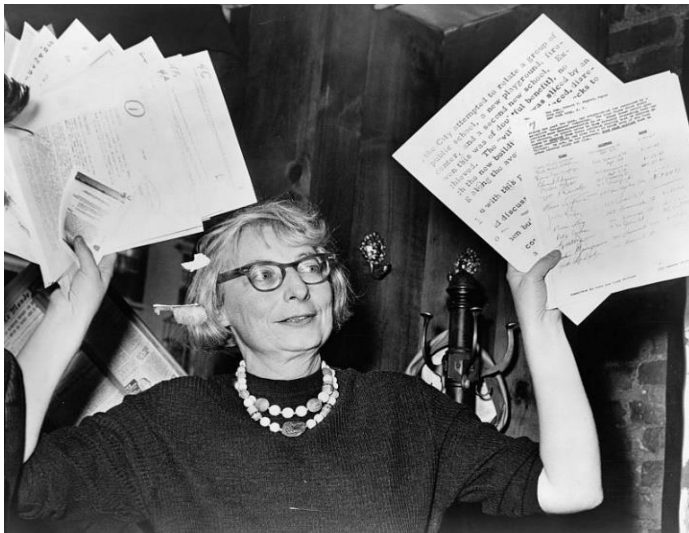
Figure 1 Jane Jacobs

Ο όρος Placemaking (βελτίωση του δημόσιου χώρου) έγινε πιο γνωστός κατά τη δεκαετία του 1990 και το μήνυμα που μεταφέρει έχει εξελιχθεί σε μεγάλο βαθμό έκτοτε.